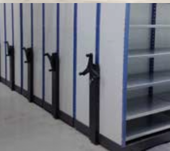
Mobila hyllsystem med manuell hantering